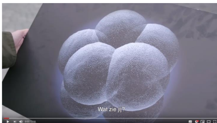
Hoe waardevol is het ongeboren leven voor jou? | Week van het leven 2018